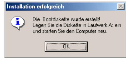
Abb. 4: Installation abgeschlossen

Nach erfolgreicher Erstellung der Diskette, erhalten Sie eine Benachrichtigung in Form einer Dialogbox (Abb. 4). Bestätigen Sie diese mit „OK“. Klicken Sie anschließend im Installationsfenster (Abb. 1) auf „Beenden“, um das Installationsprogramm zu schließen.