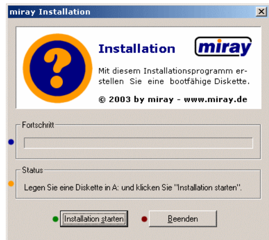
Abb. 1: Hauptfenster des Installationsprogramms

Um mit der Installation des Programms zu beginnen, legen Sie eine leere Diskette in das Laufwerk A: ein. Klicken Sie dann auf „ Installation starten “.